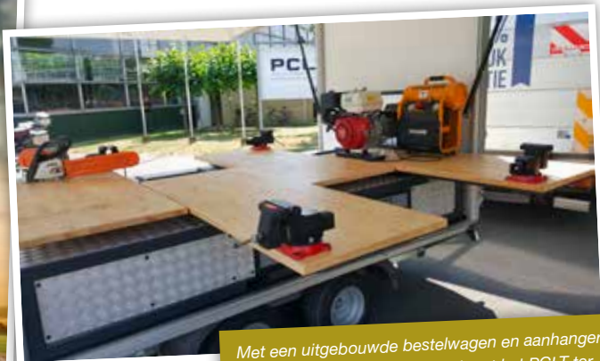
Met een uitgebreide bestelwagen en aanhanger met werkbanken en materiaal komt het PCLT ter plaatse om opleidingen voor groepen te organiseren.