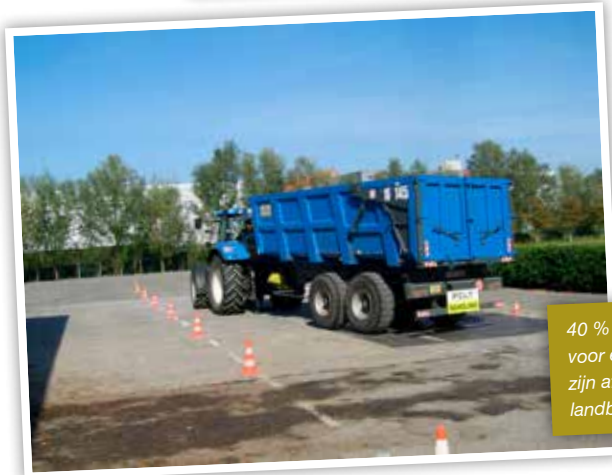
40 % van de mensen die voor een G-rijbewijs komen, zijn afkomstig van buiten de landbouw.