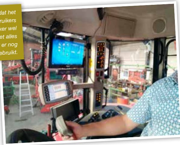
Uit de praktijk blijkt dat het merendeel van de gebruikers van een nieuwe trekker wel een machine heeft met alles erop en eraan, maar er nog niet eens de helft van gebruikt.